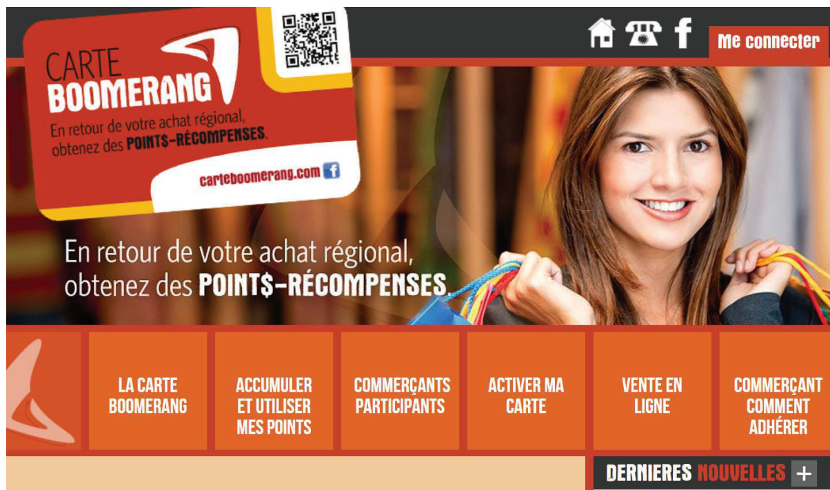
Figure 2 – Site Web initial du programme Fidélité Boomerang

En septembre 2015, soit près de deux ans après le lancement de Boomerang inc., les choses semblent graduellement se débloquer. L'entreprise développe son premier concept alliant carte de fidélité et plateforme Internet, comme le présente la figure 2.